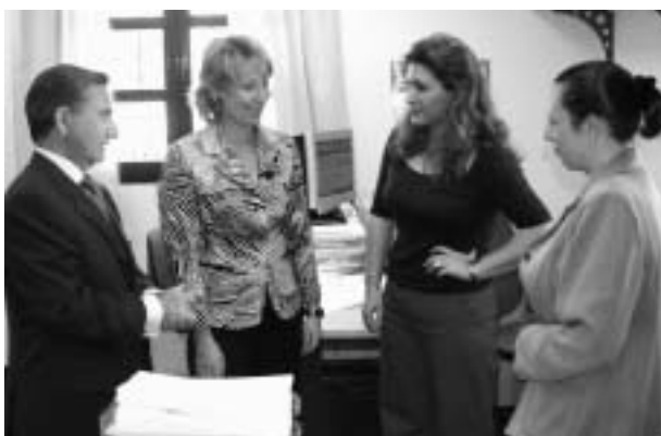
La Presidenta de la Comunidad de Madrid inauguró el pasado mayo la ampliación y reforma de las dependencias del Ayuntamiento, que supusieron una inversión de 1,3 millones de euros.

Durante el año que acaba de finalizar, se han gestionado los nuevos desarrollos urbanísticos del vigente Plan General de Ordenación Urbana de Villanueva del Pardillo (1998-2007). Un total de 1.512 viviendas, 76.551 metros cuadrados de zonas verdes y 42.180 metros cuadrados de equipamientos son algunos de los datos que ofrece el desarrollo de la segunda parte del PGOU, por el que se estima un tope poblacional de 18.000 a 20.000 habitantes.