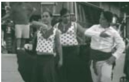
El grupo de danza de La Casona participó en las fiestas "Chions en flor" del año pasado

La Concejalía de Hermanamientos ha abierto el plazo de inscripción para la visita abierta al municipio francés de Luisant, que tiene prevista llevarse a cabo del 29 de abril al 2 ó 3 de mayo.