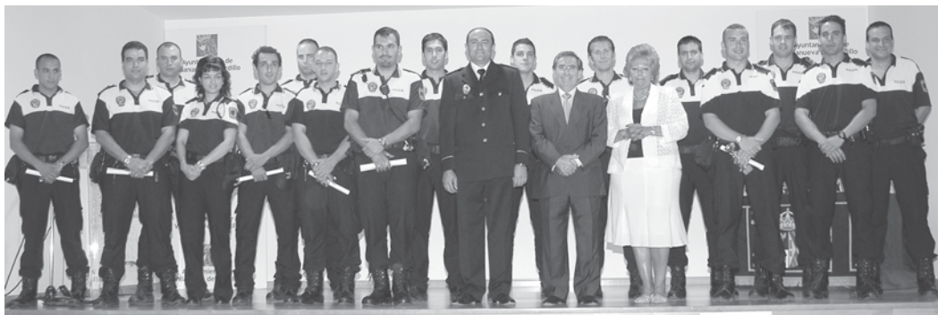
Entrega de felicitaciones y placas a los agentes locales con motivo de San Juan.