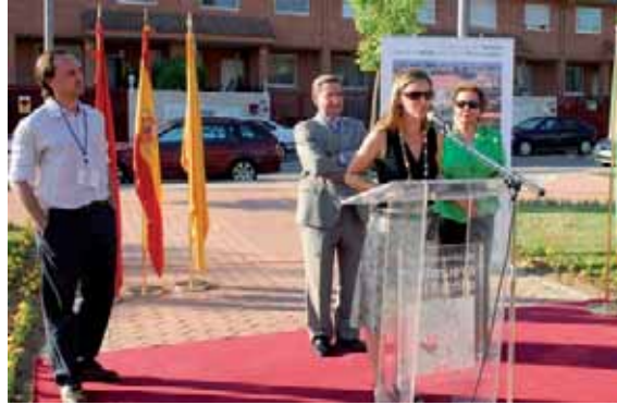
Presentación de la Bandera Verde en el Parque Federico García Lorca.

La dehesa boyal constituye, por otra parte, un verdadero pulmón verde de Villanueva del Pardillo. La pasada primavera, enmarcado en el Plan de Repoblación de la Comunidad de Madrid, se llevó a cabo la plantación de 17.000 nuevos árboles. Las especies plantadas, encinas, fresnos, chopos,