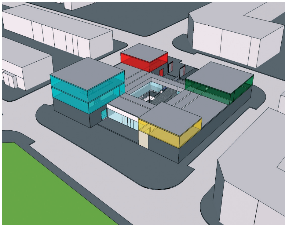
Anteproyecto propuesto por el Ayuntamiento a la Comunidad de Madrid.

Se trata de un anteproyecto que desde el Departamento de Servicios Técnicos del Ayuntamiento se ha elevado a la Comunidad de Madrid para su aprobación definitiva. El anteproyecto de esta edificación, con una superficie construida de 2.055 m 2 , se levantará en torno a un patio central en el que se distinguirán en las cuatro esquinas los cuatro usos previstos, resaltados por prismas de vidrio. Contará, además, con dos sótanos en los que se dispondrán tanto de servicios propios de cada actividad como zonas de aparcamiento oficial.