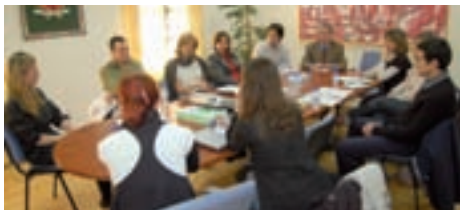
Firma del Convenio de Ecoescuelas.

Con la finalidad de aumentar la conciencia de los estudiantes sobre temas relacionados con el medio ambiente y el desarrollo sostenible, proporcionando un sistema integral de gestión y certificación ambiental, la Concejalía de Medio Ambiente ha formalizado el convenio marco del proyecto Ecoescuelas con los centros escolares Rayuela, San Lucas, Vallmont, la escuela infantil Virgen del Soto y la Asociación de Educación Ambiental y del Consumidor (ADEAC).