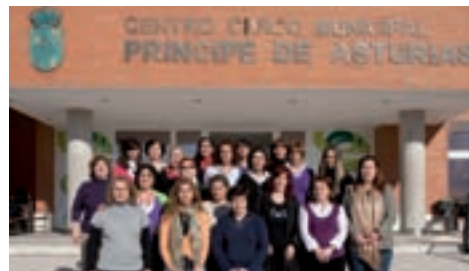
Participantes del Taller de Empleo.

Si desea recibir información para participar en sucesivas ediciones de talleres de empleo o si su empresa quiere contratar alumnas formadas con