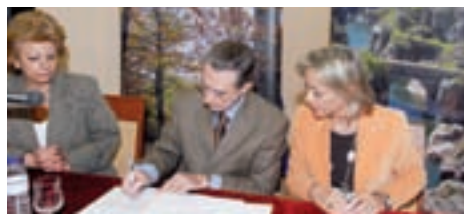
Adhesión al convenio de promoción de la Sierra Norte.