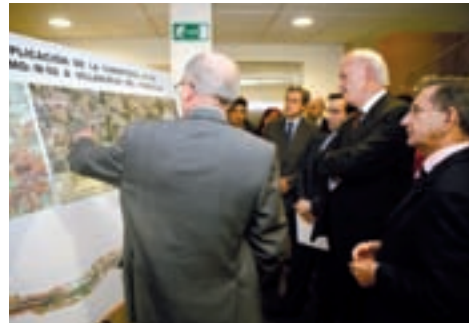
Presentación del proyecto técnico.

"Este proyecto cumple todos los objetivos que nos hemos marcado desde la Comunidad de Madrid: mejorar la seguridad vial, garantizar el derecho a la movilidad, mejorar las comunicaciones en la corona metropolitana y las zonas rurales y preservar