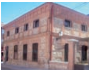
Biblioteca Municipal La Casona.

“Actualmente estamos a la espera del suministro del mobiliario