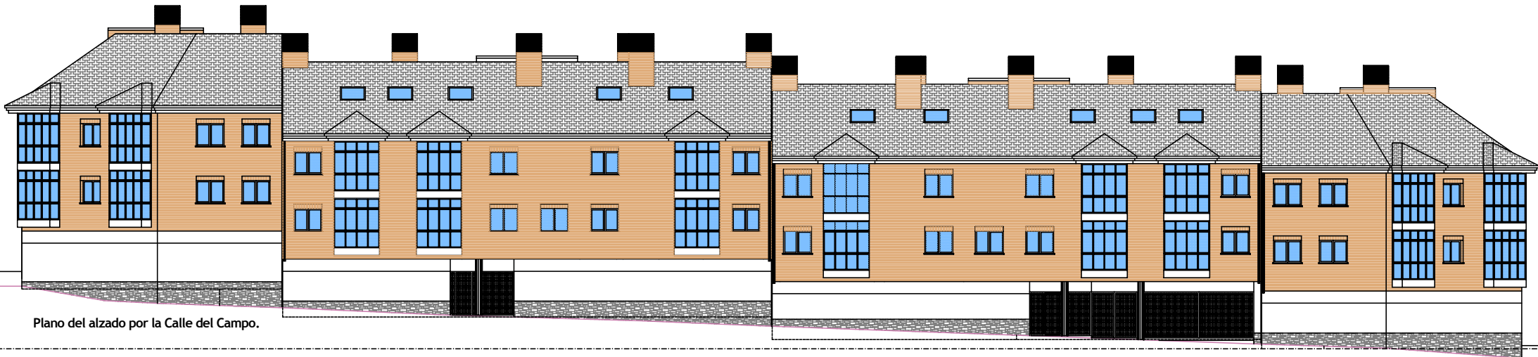
Plano del alzado por la Calle del Campo.