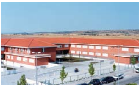
Instituto de Educación Secundaria Sapere Aude.

D esde que el Equipo de Gobierno tuvo conocimiento de que la Comunidad de Madrid planteaba un recorte de rutas escolares para el próximo curso, se puso en contacto con la Consejería de Educación con el fin de garantizar el transporte escolar para todos los alumnos de Educación Secundaria Obligatoria que estudian en el Instituto Sapere Aude.