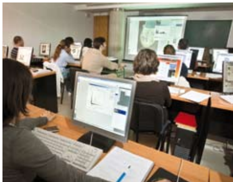
Clase de Técnico Auxiliar de Diseño Gráfico. | TECO

E l Centro de Formación de Villanueva del Pardillo ha impartido en la edición 2008/09 doce cursos del Plan de Formación para el Empleo de la Comunidad de Madrid, cofinanciados por el Fondo Social Europeo.