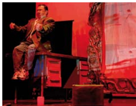
Momento del espectáculo "Crag", del C.O. Afanías.

La muestra teatral tendrá lugar del próximo día 14 al 21 de este mes de mayo en el Auditorio Municipal Sebastián Cestero en horario de mañana.