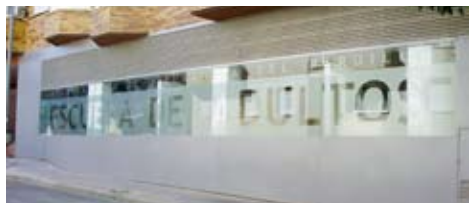
Nueva Escuela de Adultos en la calle Río Alberche.

Con 255 metros cuadrados, cuenta con cinco aulas, una de informática y un aula taller, y salas de profesores y de reuniones. La obra que ha supuesto una inversión de más de trescientos mil euros, ha sido financiada a través del Plan de Cooperación de la Comunidad de Madrid, el Ministerio de Administraciones Públicas y el Ayuntamiento de Villanueva del Pardillo.