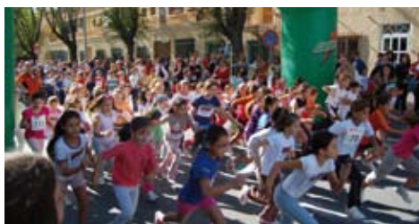
Salida de la Carrera Popular, San Lucas 2008.

Como novedad, este año destacan en el apartado gastronómico la celebración del I Concurso de Tortilla (jueves 15 de octubre) y de la I Ruta del Tapeo (del 16 al 18 de octubre).