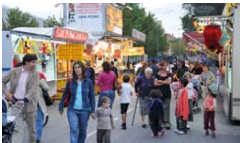
Recinto Ferial, San Lucas 2008.