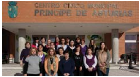
Alumnas del Taller de Empleo “Acompaña” durante el pasado curso.

Asimismo, la Concejalía de Desarrollo Local ha iniciado 19 cursos de formación para el empleo: In-