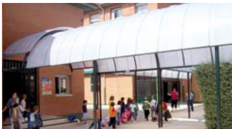
Nueva pérgola en el Colegio Público San Lucas.

Se han realizado actuaciones como la reparación del parquet del gimnasio y la pintura de los módulos de Educación Infantil y las puertas de entrada del Colegio San Lucas , así como la instalación de