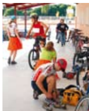
Participantes del Raid Multiaventuras