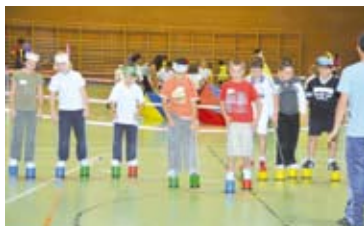
Gran fiesta infantil