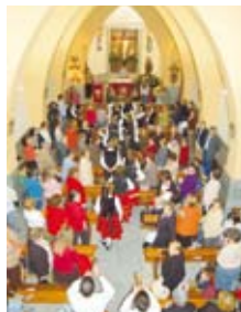
Rezo de Vísperas