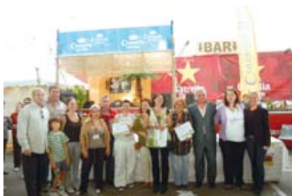
Ganadores del I Concurso de Tortillas