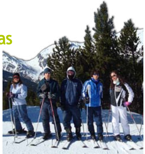
Viaje de esquí del I.E.S. en marzo de 2009.

Además, como en años anteriores, la Concejalía de Juventud e Infancia ha colaborado en la organización