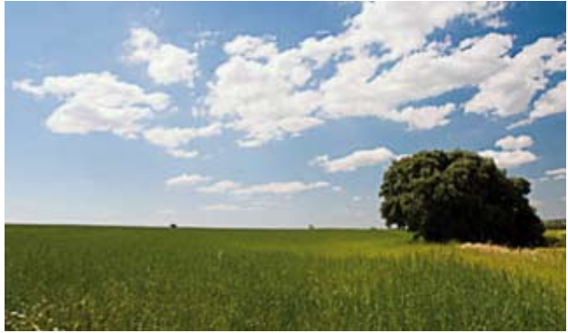
Campos de cultivo junto al polígono industrial

E l Ayuntamiento, a través de las distintas concejalías como Medio Ambiente, Innovación Tecnológica y Ordenación del territorio, ha diseñado un programa de actuaciones a realizar con cargo al Fondo Estatal para el Empleo y la Sostenibilidad. A nuestro municipio le corresponde 1,2 millones de euros en inversiones.