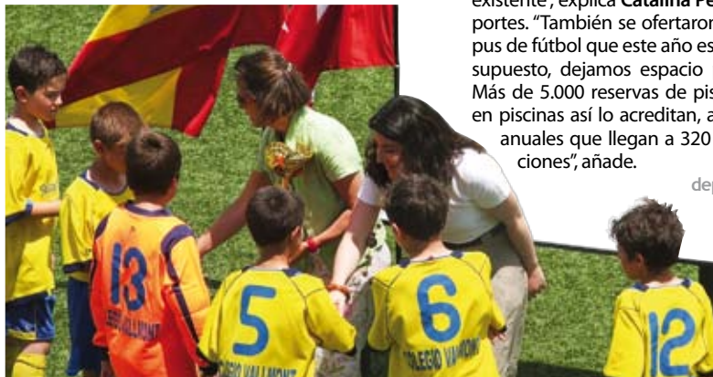
Entrega de premios a los Benjamines del Torneo de Fútbol 7