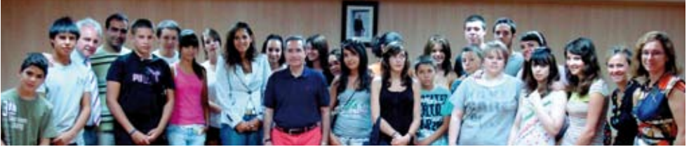
Recepción de hermanamientos del pasado verano.