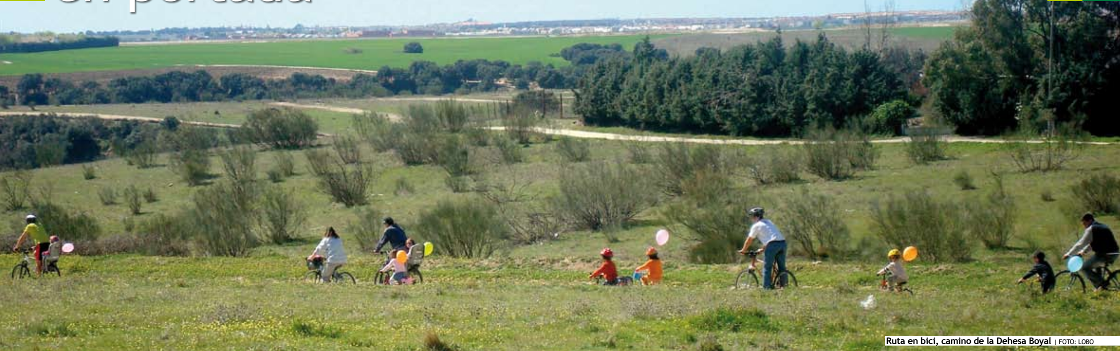
Ruta en bici, camino de la Dehesa Boyal