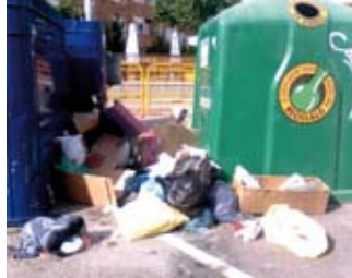
Estado del entorno de los contenedores de la Avda. Juan Carlos I. Antes y después de su recogida.