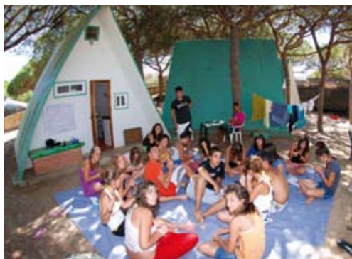
Campamento juvenil verano 2009

Con un precio de 165 euros, las inscripciones se pueden realizar a partir del 20 de septiembre y hasta el 13 de octubre. El viernes 15 de octubre se publicará la lista de admitidos.