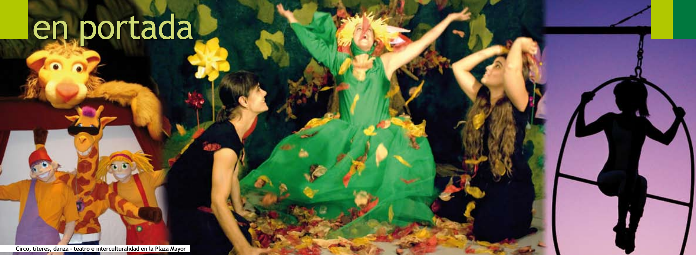
Circo, títeres, danza - teatro e interculturalidad en la Plaza Mayor