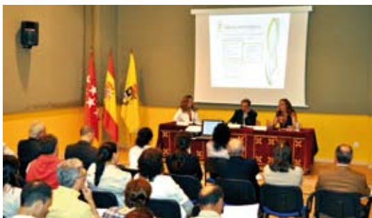
Presentación del Plan de Dinamización en el Centro Cívico

Los empresarios y comerciantes presentes recibieron un dossier informativo del primer Plan de Dinamización del Comercios y la Empresa Local y un cuestionario para recoger sus propuestas y sugerencias para futuras actuaciones, que se irán concretando en las diferentes mesas de trabajo entre comerciantes, empresarios y la propia Concejalía de Desarrollo Local.