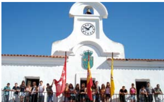
Recepción de participantes en el intercambio del verano pasado

tividades de intercambio juvenil. El próximo 13 de julio, 20 jóvenes del municipio italiano de Chions y de Villanueva del Pardillo participarán de una recepción en el ayuntamiento.