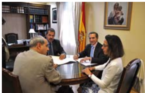
Firma de convenio con la Universidad Camilo José Cela

Durante el verano, los estudiantes pardillanos también se han ofertado cursos gratuitos, como el II Summer Media School de la Universidad Francisco de Vitoria o los cursos de verano de la Universidad Camilo José Cela.