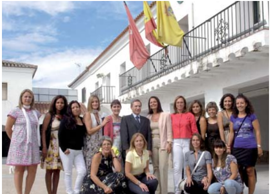
Participantes del Taller de Empleo "Educa". | FOTO C. MADRID

A lo largo de este año, la Comunidad de Madrid, ha destinado a programas de formación y empleo en Villanueva del Pardillo casi un millón de euros para poner en marcha Acciones de Orientación para el Empleo y Autoempleo (OPEAS), impartir 20