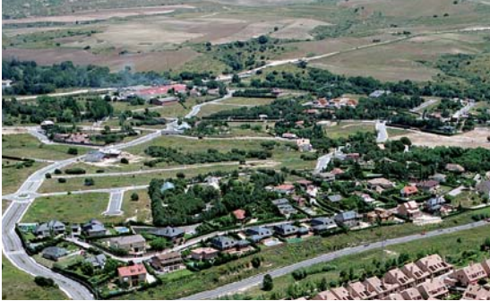
Vista aérea de la Urbanización Las Vegas